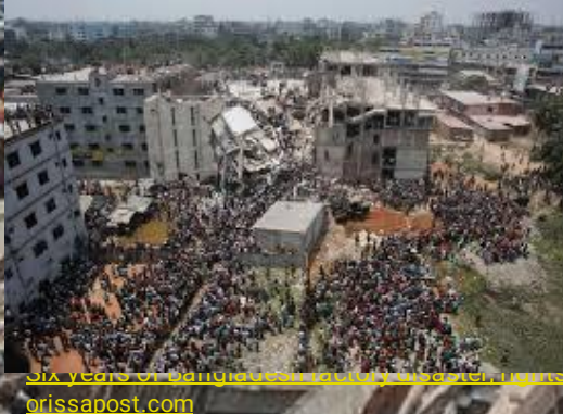
Six years of Bangladesh factory disaster, rights groups issue 'edm' warning - OrissaPOST orissapost.com