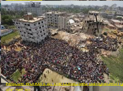
Rescue workers at the collapsed Bangladesh garment factory in April this year.