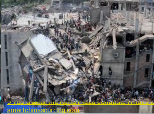
5 years after the Rana Plaza collapse, what's changed in Bangladesh's garment factories? - Smart China Sourcing smartchinasourcing.com